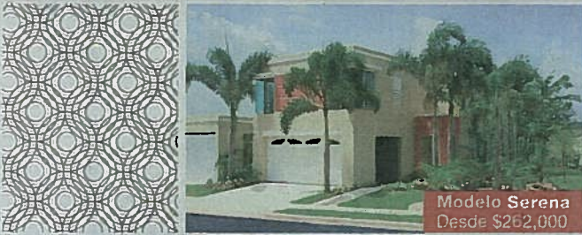
Modelo Serena Desde $262,000

¡Y aprovecha el Crédito Contributivo hasta $25,000*!